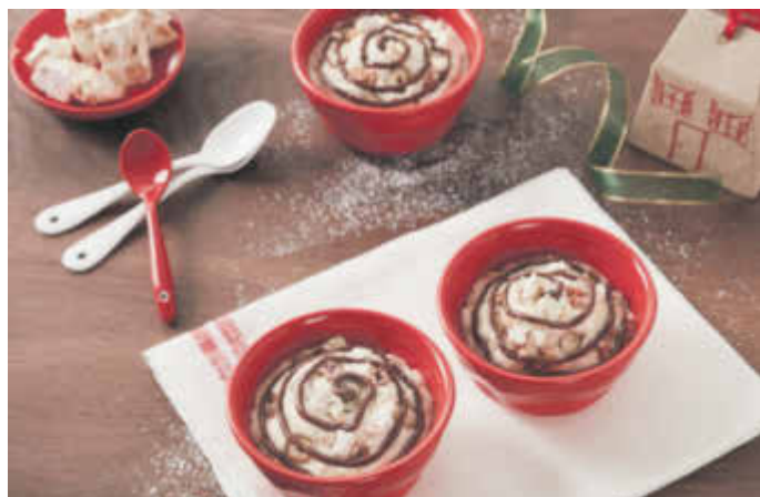
Das Nougatdessert begeistert die ganze Familie und alle Freunde.

Nougat und Amarettini werden in kleine Stücke geschnitten. Dann wird die Sahne mit Zucker steif geschlagen. Danach die Nougat- und Amarettinstücke unter die geschlagene Sahne heben und die Mischung etwa zwei Stunden kaltstellen. Jetzt das Dessert in kleine Schälchen füllen, mit Nuss-Nougat-Creme wie Nutella verzieren, mit Puderzucker bestäuben und servieren.