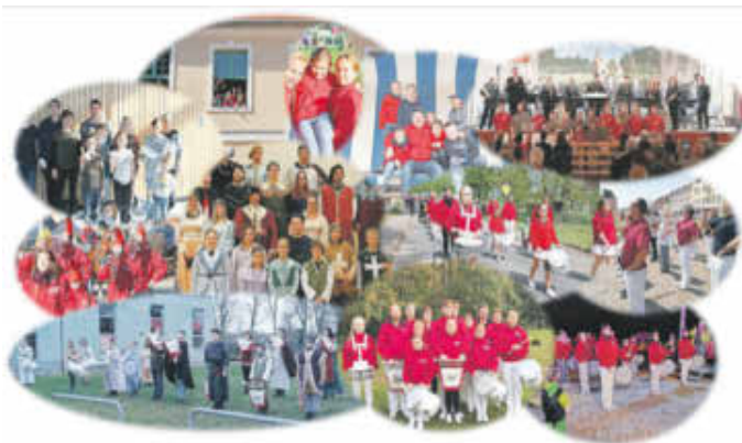
Die Mitglieder des Friedländer Fanfarenzuges

Allen eine frohe, aber auch besinnliche Weihnachtszeit und einen frohen und gesunden 2020.