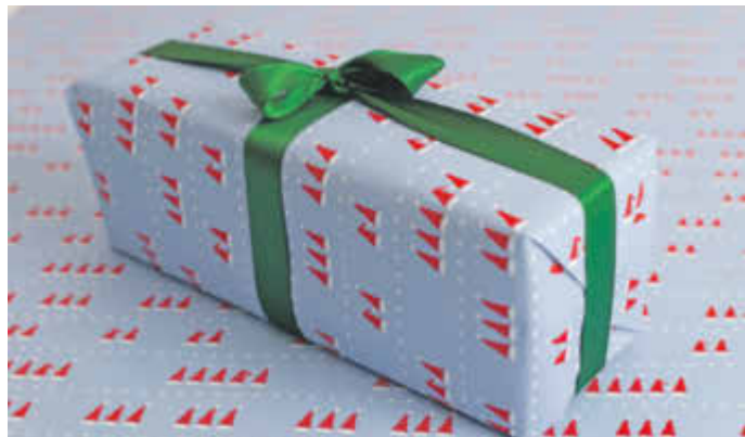
Weihnachten ist das Fest der Rituale. Auf das Einpacken der Geschenke will kaum jemand verzichten.

(djd). Der Weihnachtsmann wird sich in diesem Jahr kritischen Fragen stellen müssen. Schließlich wird das vieldiskutierte Problem des Verpackungsmülls an den Feiertagen besonders